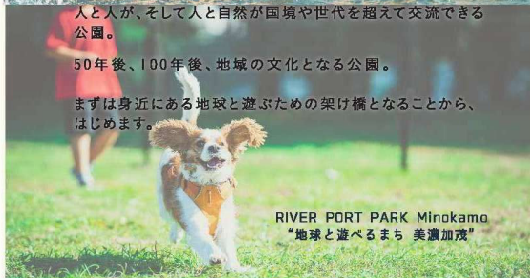
RIVER PORT PARK Minokamo “地球と遊べるまち 美濃加茂”