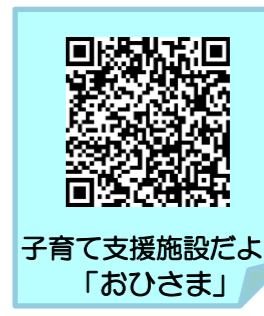
子育て支援施設だより「おひさま」