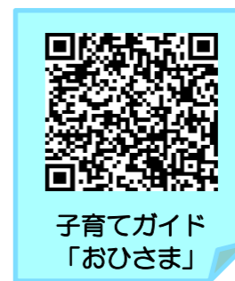
子育てガイド「おひさま」