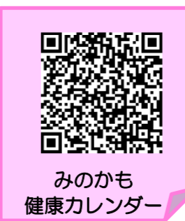
みのかも健康カレンダー