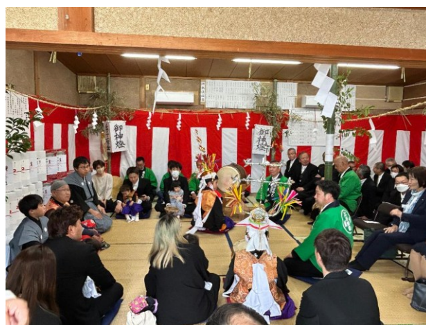
お祭り前夜の夜囃子の様子

則光自治会は、伝統のあるお祭りを守りながら、皆さんの「このまちに住んでよかった」という笑顔のために、これからも活動を続けてまいります。