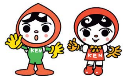
▲人KENまもる君、あゆみちゃん