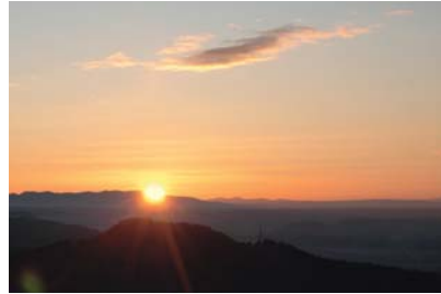
▲米田白山からの初日の出