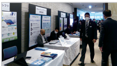
(SDGsまつり:昨年度の様子)