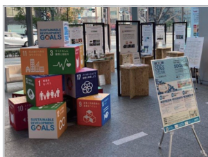
(SDGsテラス:昨年度の様子)