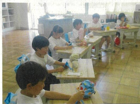
1年生も「あいうべ体操」がんばっています