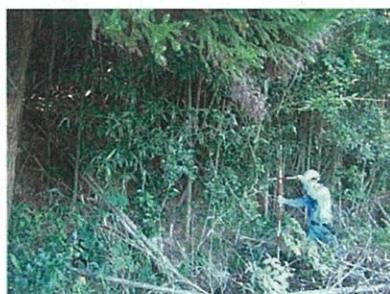
斜面の勾配・高さを確認