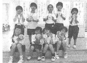
【1年生を迎える会での1年生ー大きな声で「さんぽ」を歌いました。6年生からメダルをもらってにっこり！】

今年度最初の全校行事でしたが、2～6年生のプレゼント（発表）はそれぞれ工夫を凝らしたとても楽しいものでした。1年生は笑顔いっぱいで大満足。ミッションは大成功でした。元気で明るく楽しくて、終わった後にじんわり心が温くなる心地よい余韻が残る素敵な会になりました。