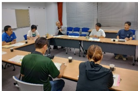
第4回「自治会行事を考える会」