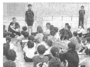
【全校朝会－しっかり聴いています】