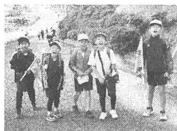
【登校－校門での元気なあいさつ】

さて、山之上小では目指す姿として6つの目標を掲げ、1年を6つの期間に分けて重点的に取り組みます。現在は第一期、目標は「着実なスタート」です。子どもたちの姿から、令和8年度も「着実なスタート」が切れていると感じています。素敵な山之上小の子どもたちがこれからどんな活躍を見せてくれるのか本当に楽しみでなりません。引き続き保護者の皆さま、地域の皆さまの温かいご支援、ご協力をよろしくお願い申し上げます。