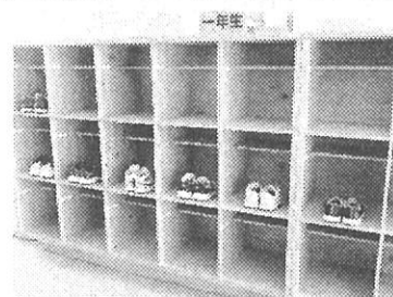
【1年生の下足箱－揃っています】