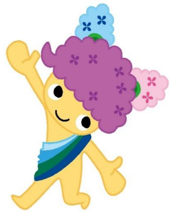
美濃加茂市健康づくりPRキャラクター「あゆみん」