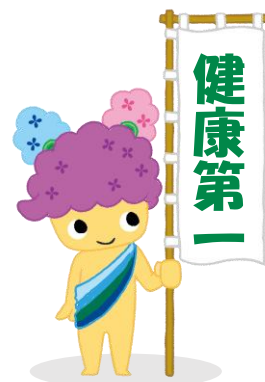
美濃加茂市健康づくり PRキャラクター“あゆみん”