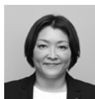
谷本 梓 議員