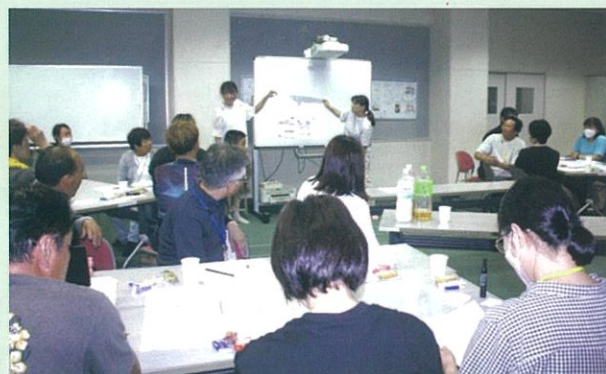
下米田小学校“サポーター交流会”の様子。夏休み最後の金曜日の夜にもかかわらず、30人以上のボランティアをされている方が集まりました。