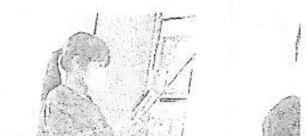
資料を示しながら説明する子