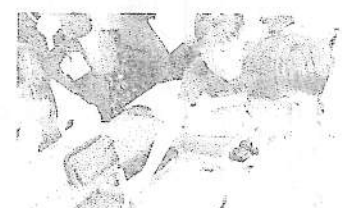
納得できるまで説明する子