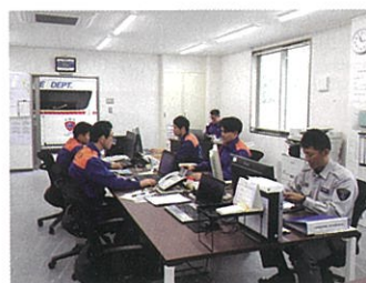
西可児分署で働く職員