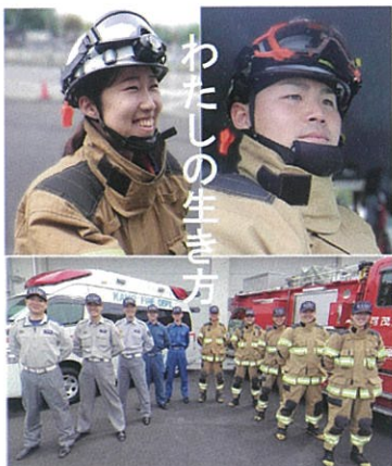
令和8年4月採用の消防職員募集!!