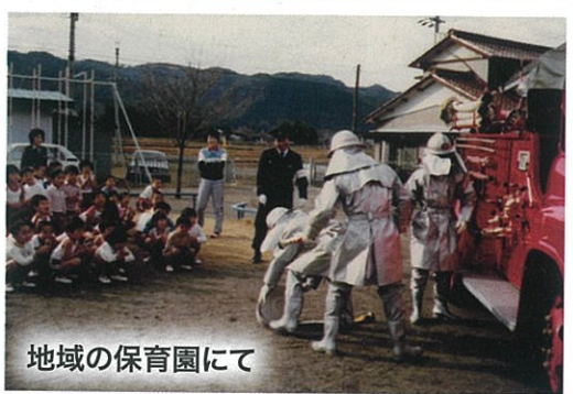
地域の保育園にて