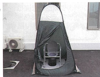
マンホール式トイレ