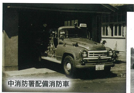
中消防署配備消防車