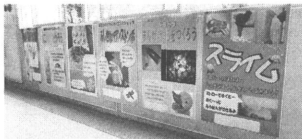
<校内に掲示されているショップのポスターの一部>

蜂屋小最大の特色ある教育活動である「わくわくサイエンスDAY」が5月31日（土）に開催されます。「スライム作り」「不思議な風車」「手作りスーパーボール」等のショップで、親子で科学実験を行います（今年度は外部から参加も含めて13のショップを準備します）。開催を間近に控え、校内では、廊下にショップのポスターが掲示されたり、サイエンスウィークの取り組みとして、昼休みに体育館で全校を対象に科学実験イベントが開催されたりするなど、「わくわくサイエンスDAY」への期待が高まっています。