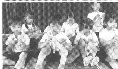
<サイエンスウィーク 実験「静電気宇宙人」>

平成15（2003）年度に文部科学省から「理科大好きスクール」に指定されたのがきっかけのようです（指定は2年間）。平成16年度に理科大好きスクールの取り組みの一環として「わくわくサイエンスショップ」を実施したのが始まりです。これが第1回になります。その時から今とほぼ同じような形態だったと聞いています。当時は、蜂屋小では理科の授業研究にも力をいれていたようで、「理科大好きスクール」としては理科の授業研究がメインだったようです。理科の授業研究は平成30年度まで続き、現在は算数の授業研究をしています。