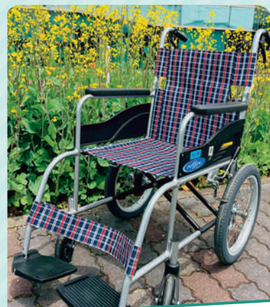
突然、車イスが必要になった方へ貸出