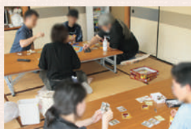
▲コミュニティカフェ(居場所)