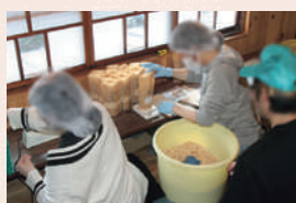
▲お菓子の袋詰め就労体験