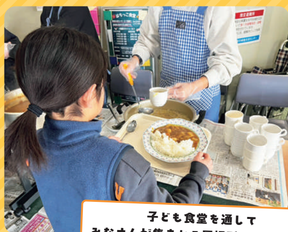
子ども食堂を通して みなさんが集まれる居場所づくりの支援