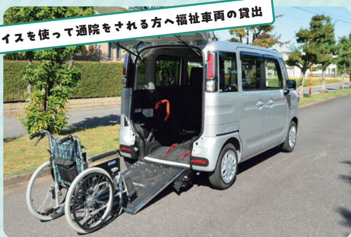
車イスを使って通院をされる方へ福祉車両の貸出