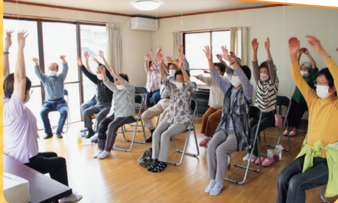
高齢者が身近な場所で集まれるように