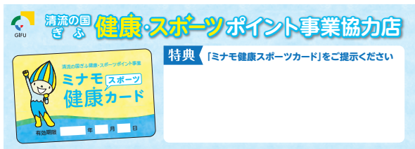
▲協力店の目印はステッカー