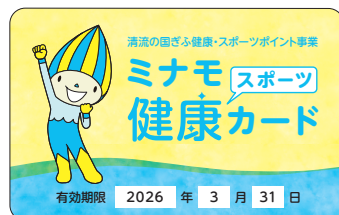
▲ミナモ健康スポーツカード