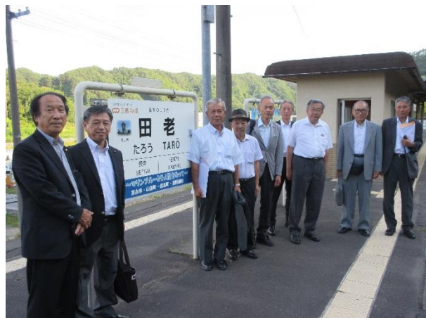
(三陸鉄道株のレトロ列車内と被災後復旧した田老駅)