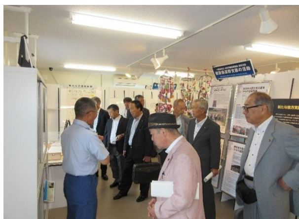
(遠野市後方支援資料館外観と内部の様子)